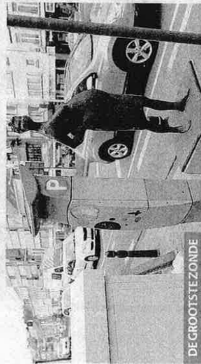
DE GROOTSTE ZONDE

'Zwanger' (Eeklo). «Het beeld wordt vernield door de electriciteitscabine en de ticketautomaat.»